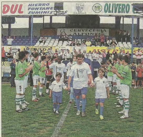
Los jugadores del Alcalá son recibidos con un pasillo por el Córdoba B.

Tras el gol, el club anfitrión quedó tocado y los visitantes pudieron sentenciar en varios contragolpes peligrosos. Y se sucedieron ocasiones fallidas de ambos, sobre todo, para un Águilas que tiró de orgullo.